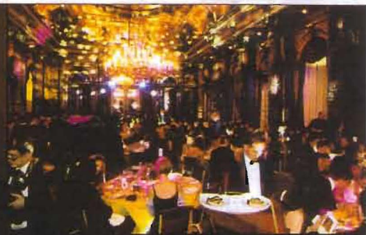
Ambiance Grand Siècle au bal Louis XIV.